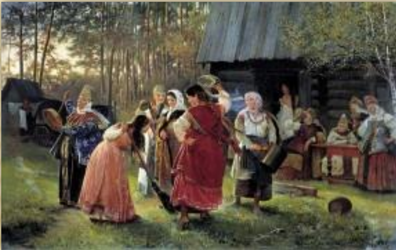
А. И. Корзухин «Девичник»