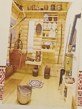
Перед нами женский угол, или бабий кут (КУТ – старинное название угла)

Степь прогорал, Жар в печи остьвал. Это кочерга – Угли мешать помогает она Для горшков место освобождает, От огня хозяйку оберегает.