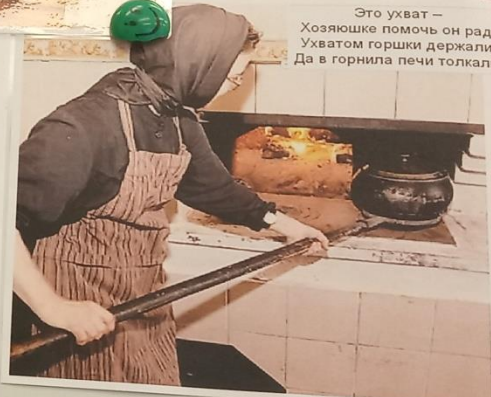
Это ухват – Хозяйшке помочь он рад. Ухватом горшки держали, Да в горнила печи толкали.